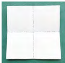
① 切り取った紙を裏返し、十字に折り目をつける