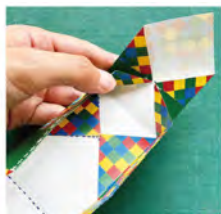
⑧ 折り目に沿って内側に折りこむ