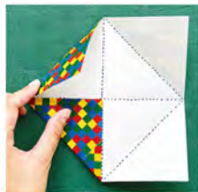
② 角を中心に向かって折る