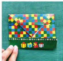
③ 上下を中心に向かって折り目をつける