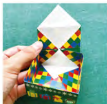
⑨ 角を箱の中の中心に合わせて折りこむ