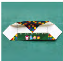
⑥ 先ほど折った折り目に合わせて上下を折る