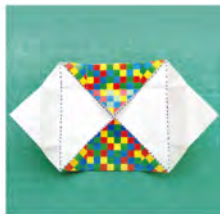
⑤ 写真のように広げる